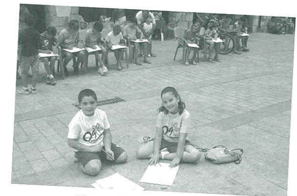
Concurs de Dibuix Ràpid