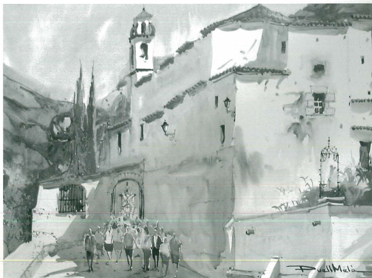
Ermita de la Pietat "Concurs de Pintura Ràpida"