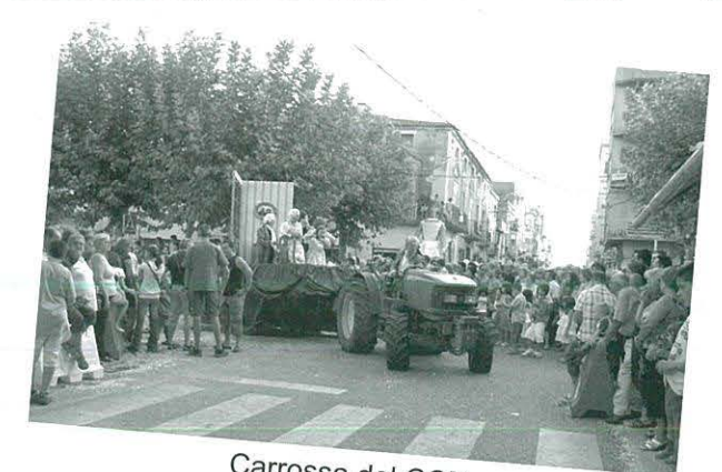
Carrossa del CCR