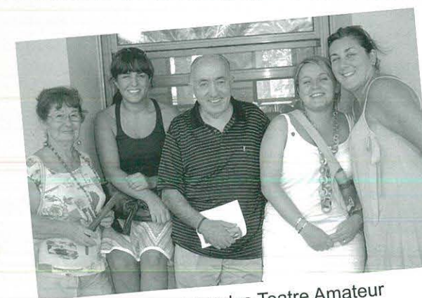
Encontre Jornades Teatre Amateur