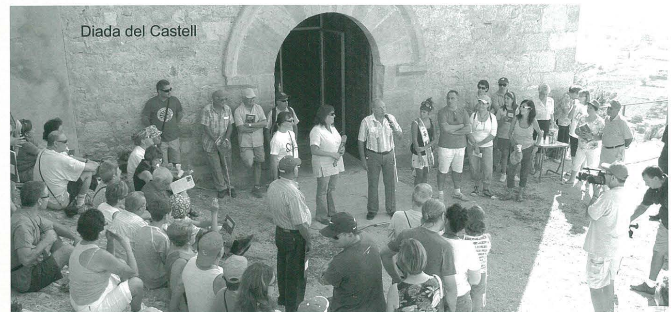
Diada del Castell